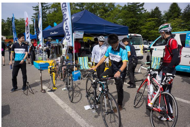
オフィシャルメカニック