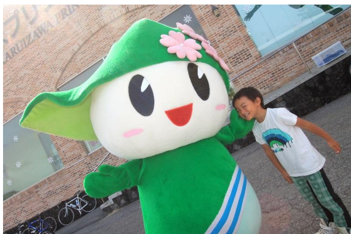
軽井沢のご当地キャラ、ルイザちゃんも応援