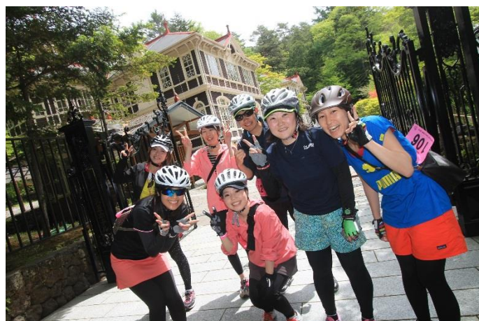
旧三笠ホテルで記念撮影