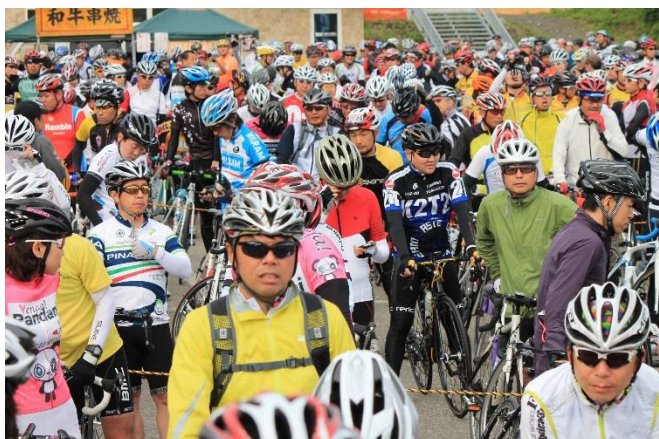
グランfond軽井沢スタート前