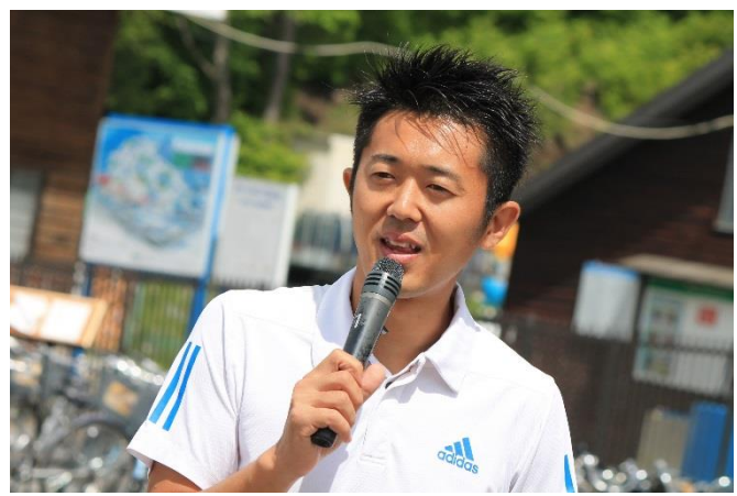
ゴールシーンではMCが会場を盛り上げました