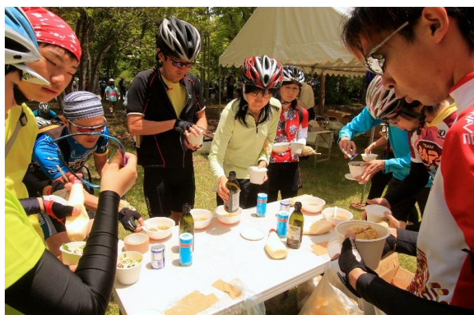
グルメフォンド～第1エイドでひと休み