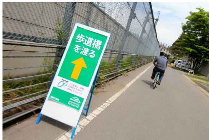
コース要所に設置された案内看板