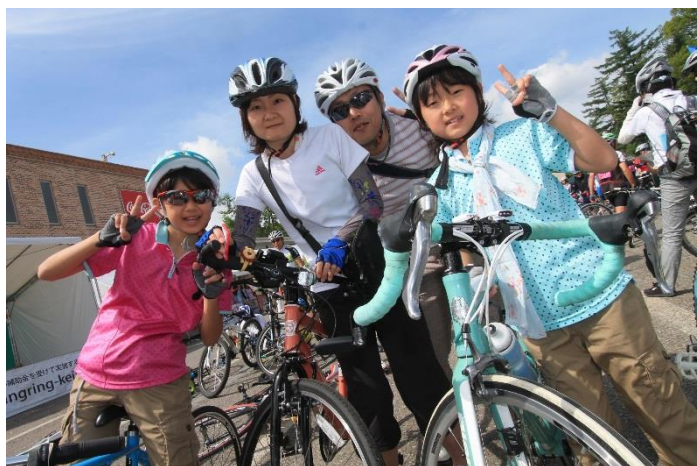
グルメfondにはご家族連れも多数参加