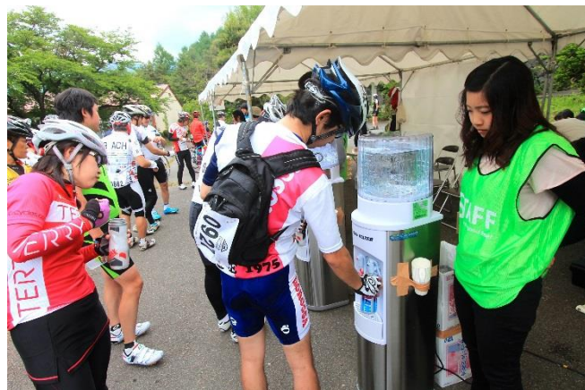
第4エイドは信州青少年の家