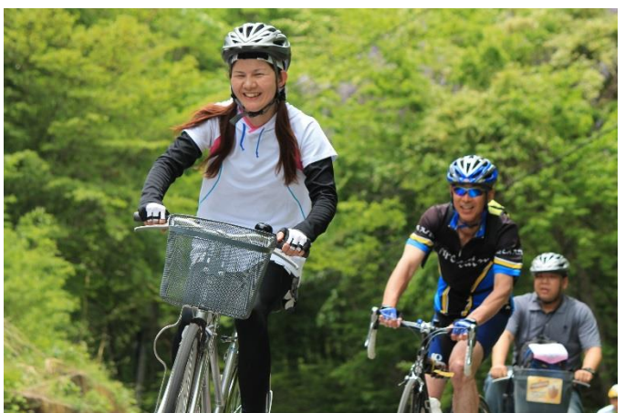
グルメフォンド唯一の難所