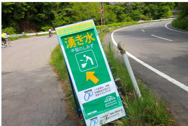
白糸ハイランドウェイは車輛規制区間