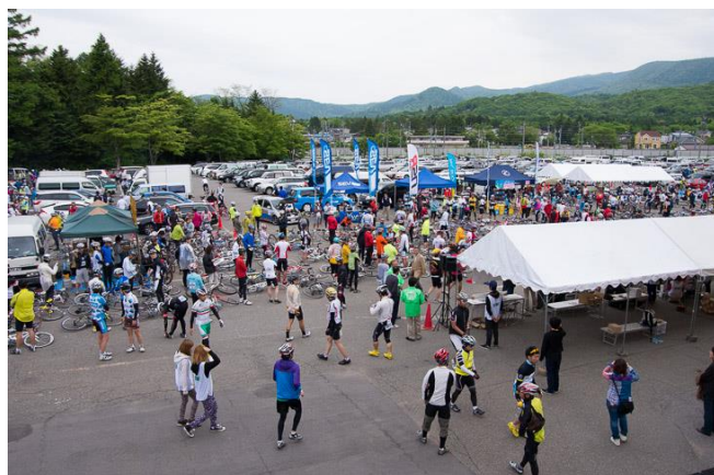
メイン会場は大賑わい