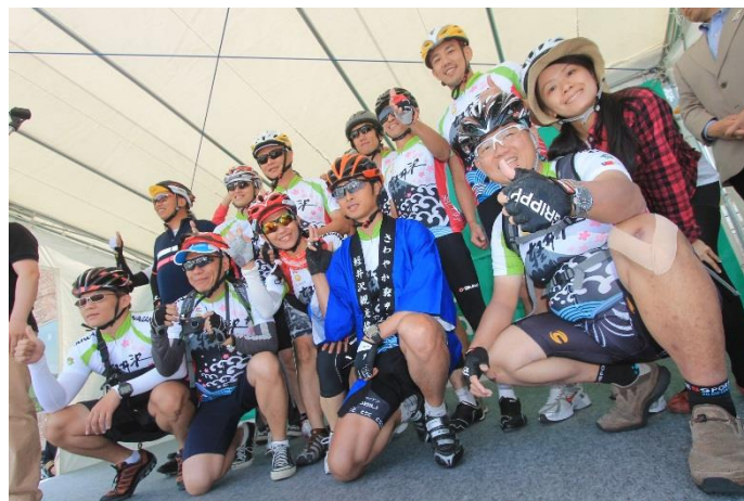
台湾からは30名が参加