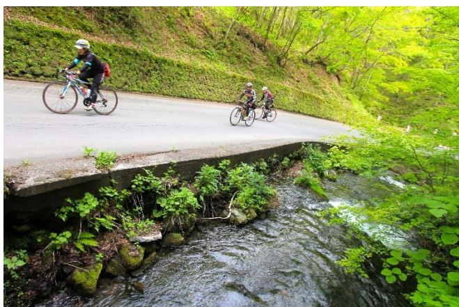
白糸ハイランドウェイは車輛規制区間