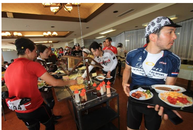
第2エイドは東海大学孺恋研修センター