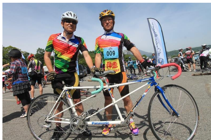
マイタンデムでエントリーの参加者