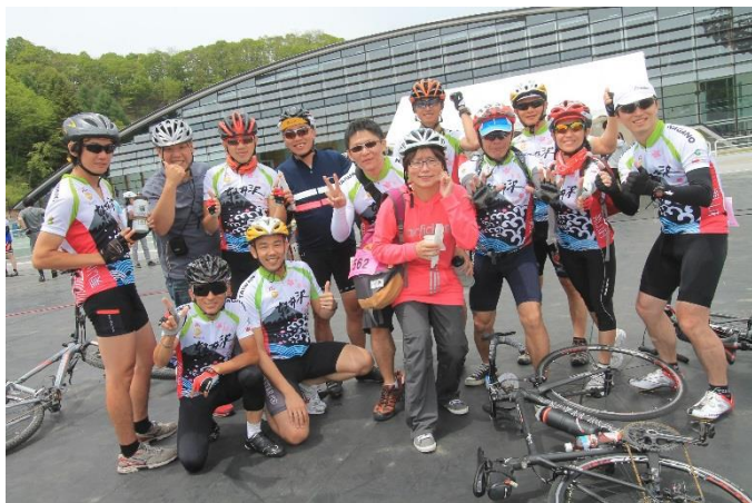
グルメフォンド第2エイド 軽井沢アイスパーク (奥は通年型カーリング施設)