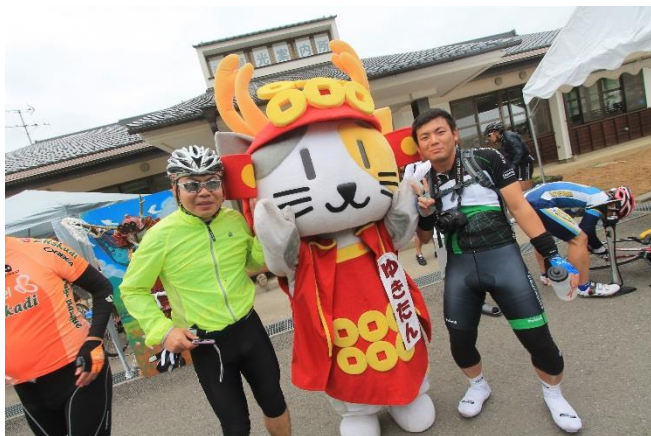
第3エイドには上田市のご当地キャラも登場