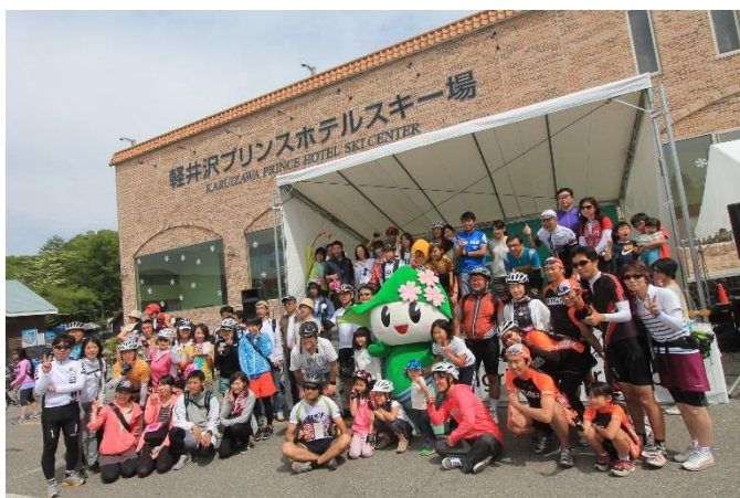
ステージにて記念撮影