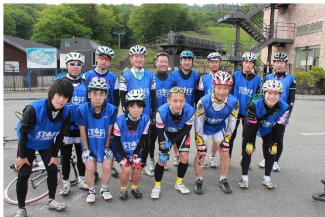
グランfond随走ライダーの面々