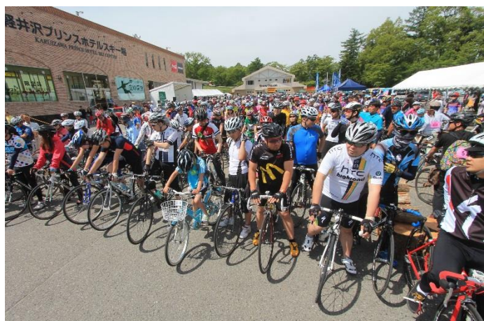
グルメフォンドスタート前