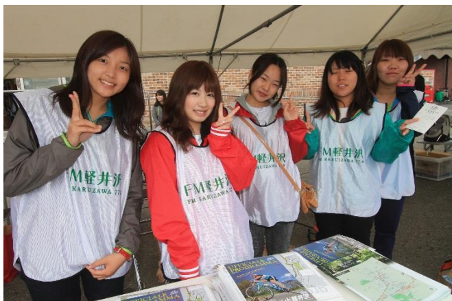
大会受付スタッフ