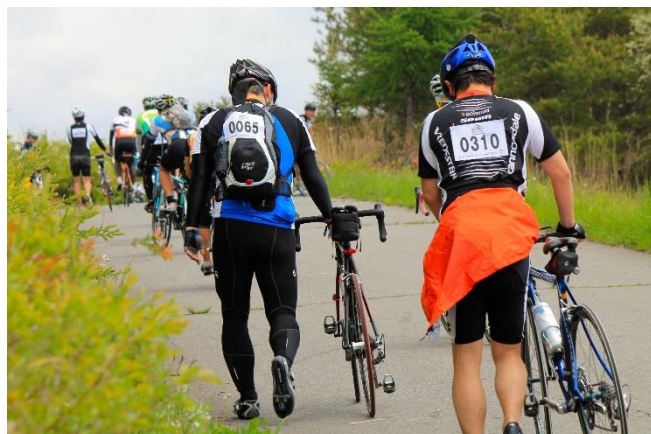
コース最高地点手前のキツイ登り坂