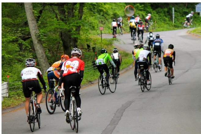
スタート 3km 地点から厳しい上りが始まる