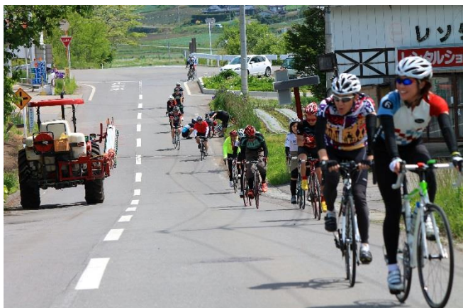
第2エイドまでもう少し