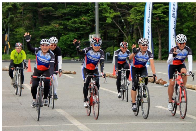
チームメートと一緒にゴール